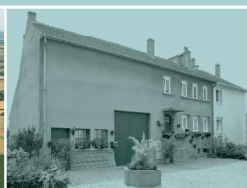
Haute-Ham, Grand'Rue : ancienne ferme allemande reprenant des principes modernistes, milieu XX e siècle