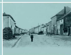
Avenue de Nieppe en 1909