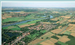
La commune vue du ciel

SAINT-LOUIS s'est développée de l'autre côté de la voie ferrée et de la RD654. Ses maisons jumelées (de deux à cinq logements) sont alignées le long d'un axe principal (rue de la Forêt). Récemment la commune s'est encore agrandie, avec de nombreuses constructions neuves, Clos la Forêt et quartier des Merisiers.