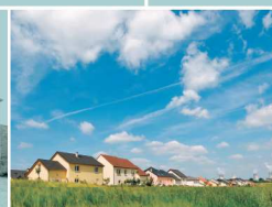
Le lotissement Saint-Louis