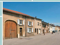
Basse-Ham, vue d'ensemble de l'avenue de Nieppe