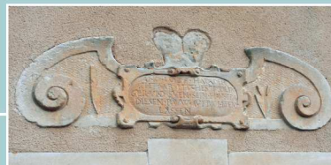
Rue de l'église : décor daté 1825 en rempli ; inscription en allemand et emblèmes de paysans

Avenue de Nieppe, partie supérieure de bildstock daté 1854