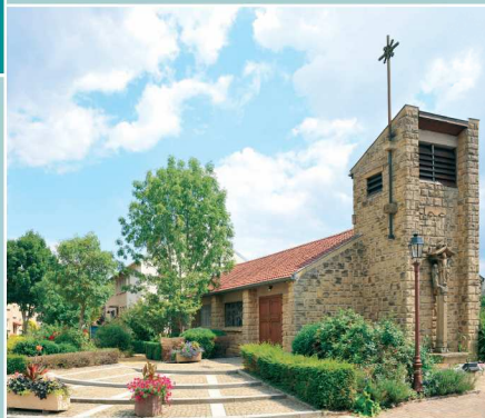
Haute-Ham, Chapelle Saint-Marc construite de 1956 à 1958 en remplacement de l'ancienne chapelle située Grand'Rue, démolie en 1955

Les deux Ham connaissent une histoire tantôt commune, tantôt séparée, Haute-Ham constituant probablement le noyau d'implantation initial. Basse-Ham est construite au XII e siècle, alors que la population augmente. À cette époque existe une troisième entité, Nerdof (détruite pendant la Guerre de Trente Ans 1618-1648). Au cours du XVIII e siècle, la population des Ham s'accroît, profitant de la consolidation d'une période de paix.